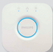
Philips Hue Bridge