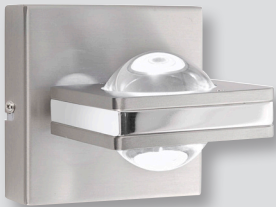
z.B. Art.-Nr. 9115-55