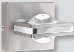
z.B. Art.-Nr. 9115-55