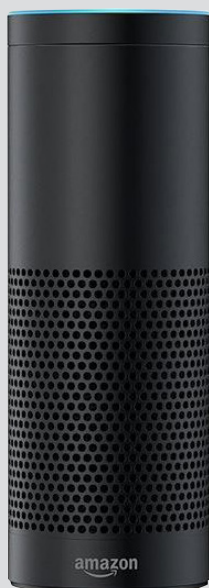
Amazon Echo Plus